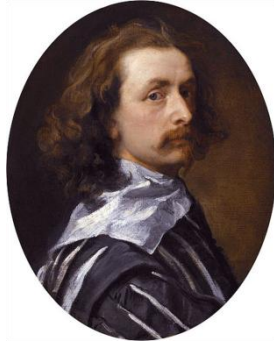
Zelfportret van de barokschilder Anthony van Dyck (Antwerpen 22 maart 1599 - Londen 9 december 1641)

Zijn werken zijn nog te zien in diverse musea.